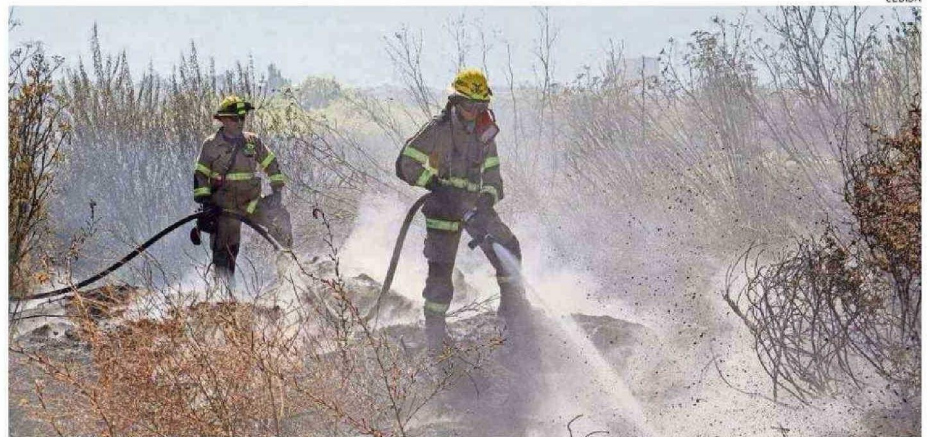
BOMBEROS DE LA PRIMERA COMPAÑÍA DE TALCAHUANO LLEVAN VARIOS DÍAS DESPLEGADOS EN COMUNAS DE LA ARAUCANÍA COMBATIENDO EL FUEGO.