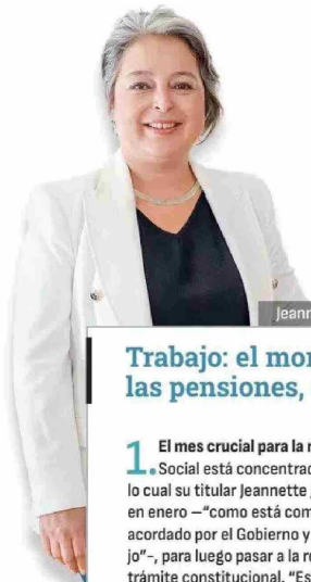
Jeannette Jara, ministra del Trabajo y Previsión Social.