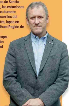
Juan Carlos Muñoz, ministro de Transportes y Telecomunicaciones.

3. Quinta generación y conectividad. Dentro del objetivo de “empujar por más presencia y más competencia en el sector”, el MTT indica que en 2025 comenzará “el despliegue de infraestructura 5G del cuarto actor adjudicatario de la nueva licitación efectuada por nuestra administración”, en referencia al proceso pendiente de WOM. Por otro lado, la cartera destacó que durante el primer trimestre “quedará firmado el contrato entre Google y la empresa pública Desarrollo País para así comenzar la obra y despliegue del cable submarino que conectará nuestro país con Oceanía”.