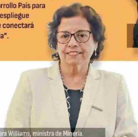
Aurora Williams, ministra de Minería.