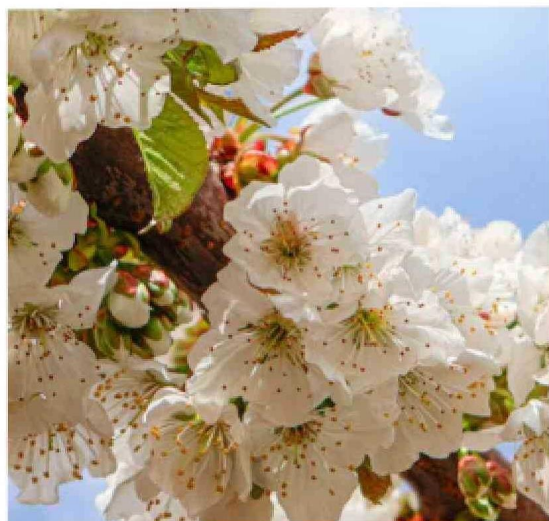
Bajo macrotúnel se ha observado un adelantamiento de la floración y cosecha de hasta 12 días.

–En síntesis, ya sabemos los efectos positivos para el cerezo del macrotúnel sobre la temperatura ambiental y de suelo a fines de invierno y temprano en la temporada. Además contribuye a una humedad del suelo más estable y mitiga la radiación solar excesiva. Sin embargo, no se recomienda mantenerlo después de la cosecha por las altas temperaturas, a menos que la ventilación sea bien manejada. La carpa de rafia reduce en mayor medida la incidencia de la radiación solar, así como el déficit de presión de vapor en comparación al aire libre durante el verano. Tanto el macrotúnel como la carpa, de manera más acentuada, reducen la temperatura de suelo a nivel superficial y de raíces cuando la temporada se encuentra avanzada. Finalmente cabe reiterar que los estreses abióticos inciden de manera negativa en la fotosíntesis, aumentan la respiración y reducen la acumulación de biomasa. Ello ocurre no solo en la temporada, sino que tiene un efecto acumulativo a lo largo de los años. Para utilizar de la mejor manera las ventajas de la tecnología de los plásticos conviene revisar las bases fisiológicas del cerezo y aplicarlas para entender sus efectos. Ra