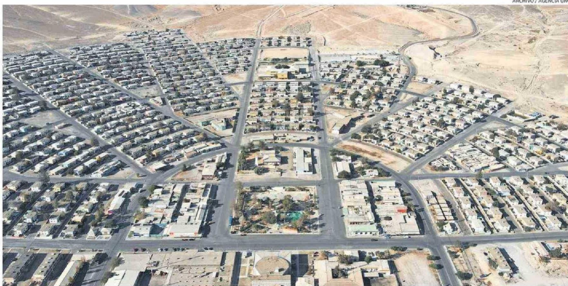
EL ASENTAMIENTO MINERO DE EL SALVADOR ES EL ORIGEN DE UNA MILLONARIA DISPUTA DONDE PROFESORES ALEGAN EL NO PAGO DE UNA ASIGNACIÓN POR 27 AÑOS.