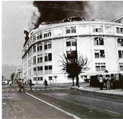
INCENDIO EN LA COMPAÑÍA CHILENA DE TABACOS DE AVENIDA COLÓN.

Las numerosas fallas ocurridas en la infraestructura, especialmente vial y sanitaria, permitieron obtener valiosa informa-