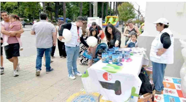
Los curicanos llegaron al Banco Chile durante toda la jornada.

Una de las actividades paralelas en la Teletón es la campaña “Familias Reciclando en Modo Bilz y Pap”, que organiza la Dirección de Gestión Ambiental y Territorio del Municipio, que este año contó con la participación de 16 establecimientos educacionales de la comuna, los que recaudaron 900 kilos de plásticos que tendrán una nueva vida útil en los establecimientos de la Teletón.