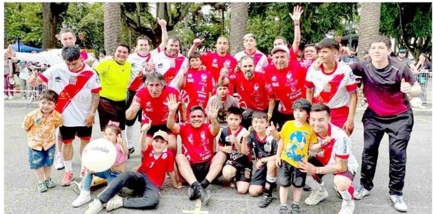
También se jugó el tradicional partido de fútbol en las inmediaciones de la Plaza de Armas.

“Queremos agradecer a toda la comunidad curicana que se ha organizado interactivamente junto al municipio, junto a los artistas, con todos los animadores, y a un grupo importante de gente que ha colaborado para que esta Teletón sea exitosa una vez más en nuestra comuna. En ese sentido, agradecer a cada una de las juntas de vecinos, las dirigentas, la gente que aportó pesito tras