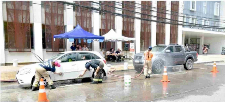
Los Bomberos realizaron la tradicional Lavatón.