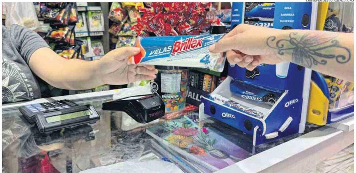
EL CORTE DE LUZ AFECTÓ A 14 REGIONES DEL PAÍS. EN LA REGIÓN FUERON MÁS DE 160 MIL CLIENTES QUE SE VIERON PERJUDICADOS POR EL CORTE DE SUMINISTRO.

ANTOFAGASTA. Mientras que la totalidad de personas ya estaban con servicio energético, se registraron cortes de agua por problemas en la planta.