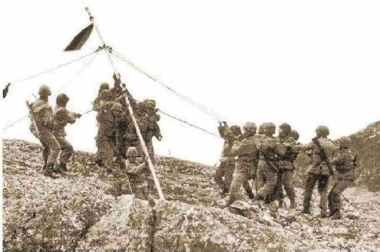
Infantes de Marina desplegados en isla Deciet en 1977.