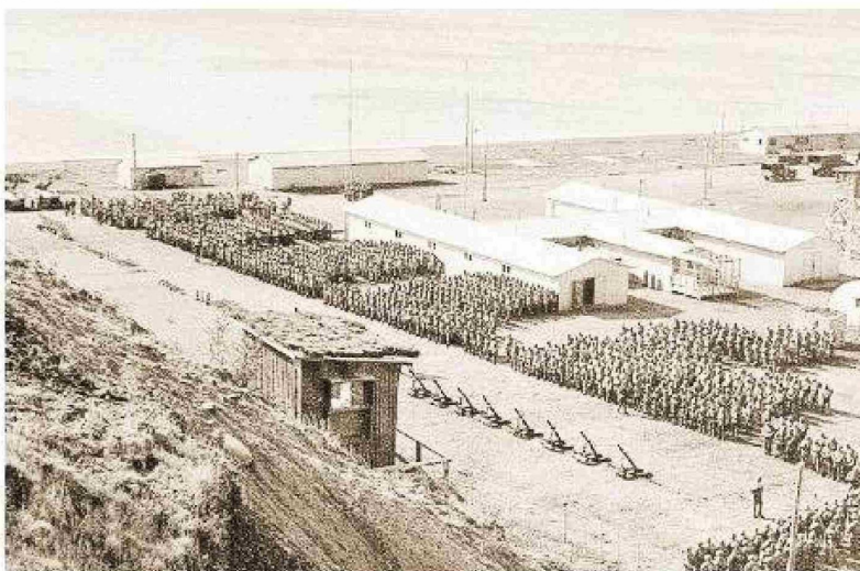
Brigada de Infantería de Marina en 1978 conformaban una importante fuerza desplegada en el Teatro de Operaciones Austral.

Portada de la décima edición del Libro "Los soldados del mar en acción".