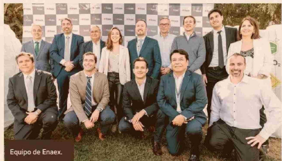
Equipo de Enaex.