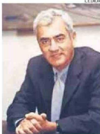
LIDERÓ MINERÍA EN 2002-2006.