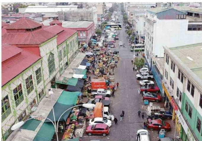
EL ESTADO ACTUAL DEL ENTORNO DEL MERCADO CARDONAL

- La vida del Cardonal se podría dividir en tres eta-