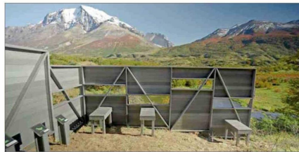
Mirador de aves en Torres del Paine, realizado con la madera plástica de EverWood