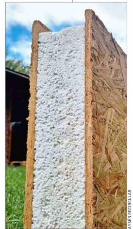
A través de la utilización de desechos de la industria salmonera, fabrican paneles aislantes

La empresa es parte del programa "Resiliencia Climática" de Corfo, ejecutado por IncubatecUFRO, que definen como "clave" para fortalecer su modelo de negocio y ampliar su impacto en la región. Con el financiamiento recibido, esperan escalar su producción y consolidarse como referentes en la economía circular del sur del país.