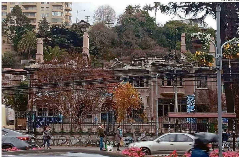
ENTRE LAS PRINCIPALES OBSERVACIONES HECHAS ESTÁ ATENDER LA FALTA DE CUBIERTA DEL INMUEBLE.