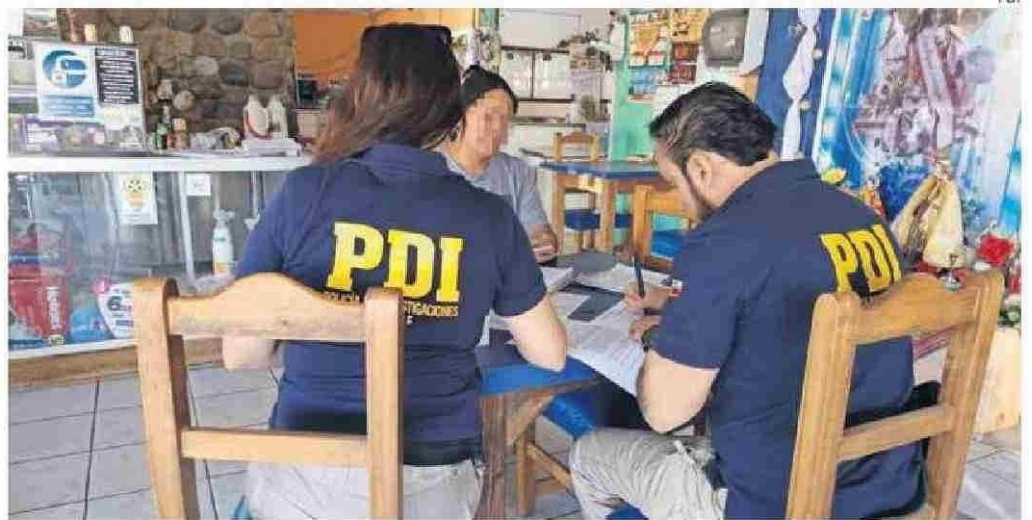
SE HAN INTENSIFICADO ESTOS PROCEDIMIENTOS DE EXTRANJERÍA EN LA ZONA.

Igualmente fueron denunciados tres empleadores por faltas al mismo