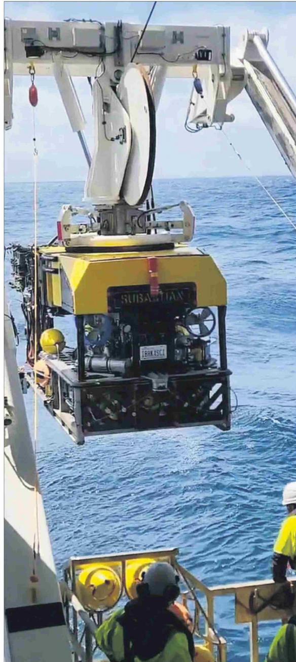
El descubrimiento fue posible gracias al robot submarino Subastian, que desciende a grandes profundidades, extrae muestras y permite observar la dorsal tectónica bajo el continente.