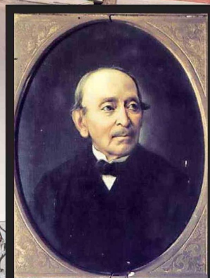
Ignacio Domeyko, científico polaco.

El inmueble colonial, que fue su hogar por más de 50 años, se encuentra en excelentes condiciones, conservando mobiliario y elementos originales que transportan al tiempo de Domeyko. Su escritorio, sus jardines y el diseño arquitectónico reflejan no solo su vida, sino también el espíritu de una época