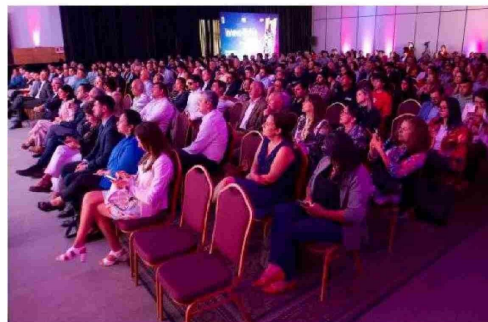
CIENTOS DE PERSONAS se hicieron presentes ayer en la inauguración del encuentro Innova Biobío.