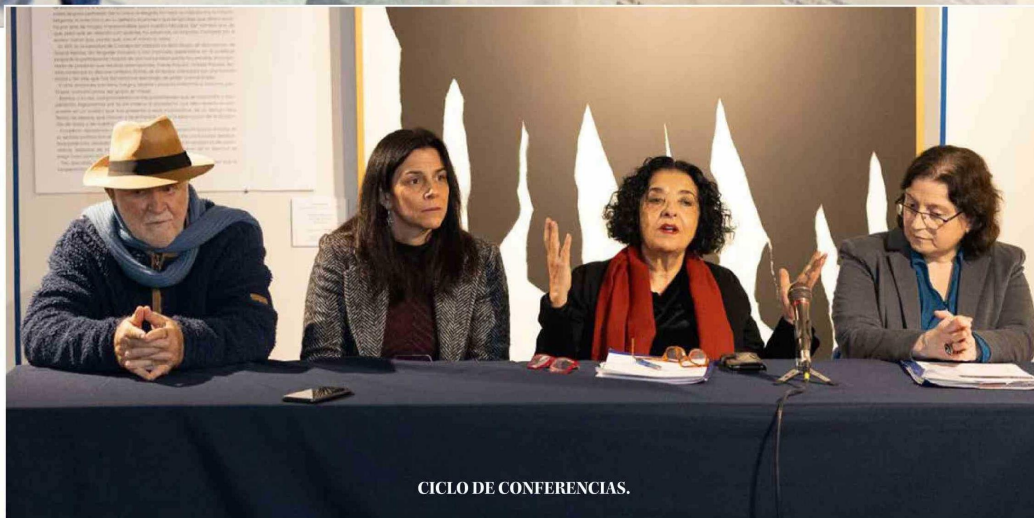
CICLO DE CONFERENCIAS.