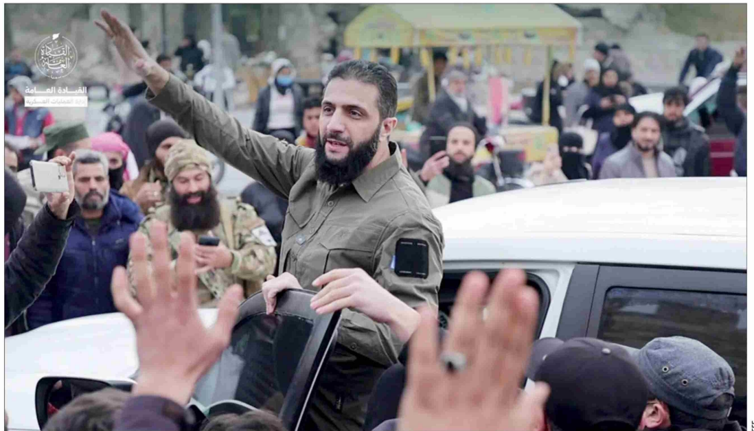
Al Jawlani es un pseudónimo. El suyo verdadero y su edad son una incógnita.

Su radicalidad era evidente. Sin embargo, el año 2013 cortó el vínculo con el EI, y se colocó bajo el paraguas de Al Qaeda. Y el 2016 rompió también con este grupo. Se dijo que