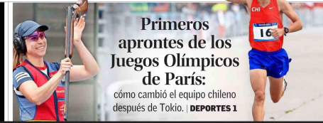
Primeros aprontes de los Juegos Olímpicos de París: cómo cambió el equipo chileno después de Tokio. | DEPORTES 1