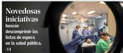
Novedosas iniciativas buscan descomprimir las listas de espera en la salud pública. | I 1