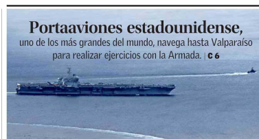
Portaaviones estadounidense, uno de los más grandes del mundo, navega hasta Valparaíso para realizar ejercicios con la Armada. | C 6