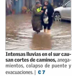
Intensas lluvias en el sur causan cortes de caminos, anegamientos, colapso de puente y evacuaciones. | C 7