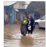
Intensas lluvias en el sur causan cortes de caminos, anegamientos, colapso de puente y evacuaciones. | C 7