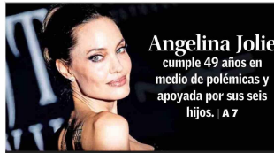
Angelina Jolie cumple 49 años en medio de polémicas y apoyada por sus seis hijos. | A 7

SANTIAGO EL 1 DE JUNIO DE 2000 / AÑO CCXXV N° 44.868 (ES PROPIEDAD)