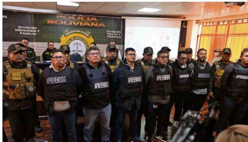
EXMILITARES Y MILITARES ACTIVOS FUERON DETENIDOS POR EL FALLIDO GOLPE DE ESTADO DEL MIÉRCOLES EN LA PLAZA MURILLO DE LA PAZ, EN BOLIVIA.

Además del encargado del cuartel de Viacha, municipio cerca de La Paz, desde donde el domingo salieron los vehículos blindados que el miércoles