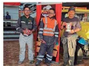
Personas presenciaron y fueron partícipes de la Obra de Teatro LOS MAZALEZ en Calama.