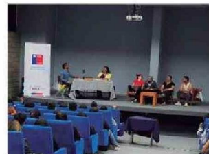
Personas presenciaron y fueron partícipes de la Obra de Teatro LOS MAZALEZ en UTA Arica.