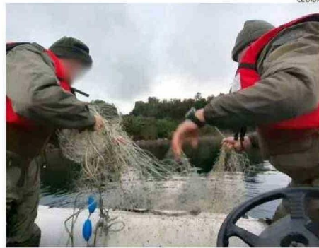
SERNAPESCA TRABAJA EN TERRENO PARA EVITAR LA PESCA FURTIVA.

por día de pesca es el máximo permitido por persona o bien alcanzar los 15 kilos (en algunos cauces es sólo 2) según indica la normativa vigente de pesca recreativa en Chile.