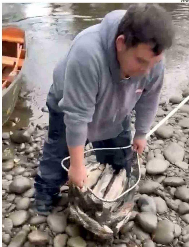
EN LA IMAGEN SE OBSERVA AL PESCADOR ILEGAL CON LA GRAN CANTIDAD DE TRUCHAS SACADAS DESDE EL RÍO.

Los dos hombres van en un bote de madera y en el video se jactan de la gran cantidad de peces que sacaron del Coihueco, los que incluso no caben en