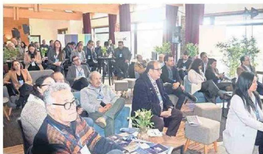
LA OCASIÓN CONTÓ CON UN IMPORTANTE MARCO DE PÚBLICO.

Evento congregó a representantes del mundo público, privado y la academia, con la finalidad de definir caminos que permitan reactivar el crecimiento local.