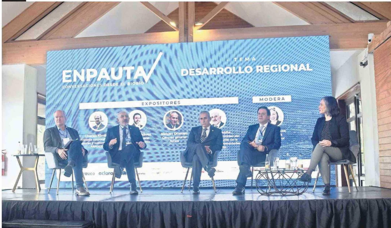
EL PANEL DE CONVERSACIÓN CON LOS EXPOSITORES Y LA DIRECTORA DE DIARIO EL SUR COMO MODERADORA.