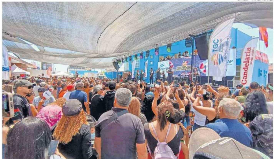
UNA MASIVA CONCURRENCIA TUVO EL CHAO PESCA'O 2025, QUE REUNIÓ A VECINOS Y TURISTAS QUE LLEGARON A DISFRUTAR PRODUCTOS MARINOS

En esta ocasión fueron unas 15 presas de pescado que frieron y lo entregaron