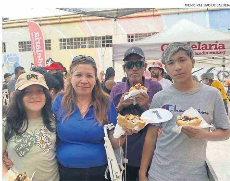
FAMILIAS DE CALDERA, LA REGIÓN Y EL PAÍS ASISTIERON A LAS DIVERSAS ACTIVIDADES DE ESTOS DÍAS.