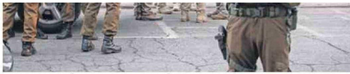
FUE LA PRIMERA ACCIÓN CON JUNTA DE AMBAS POLICÍAS DESDE QUE ENTRÓ EN VIGENCIA LA REFORMA PENAL.

Tras estos allanamientos quedó en evidencia la estructura que se armó en torno al narcotráfico en el sector, dado que estos delincuentes compraron la mitad de las viviendas del pasaje Las Flautas, con pagos de hasta 90 millones de pesos. Y convirtieron estas viviendas en bunkers blindados para el acopio y venta de droga, tenían sistema de vigilancia por cámaras y se tomaron una multicancha, que ce-