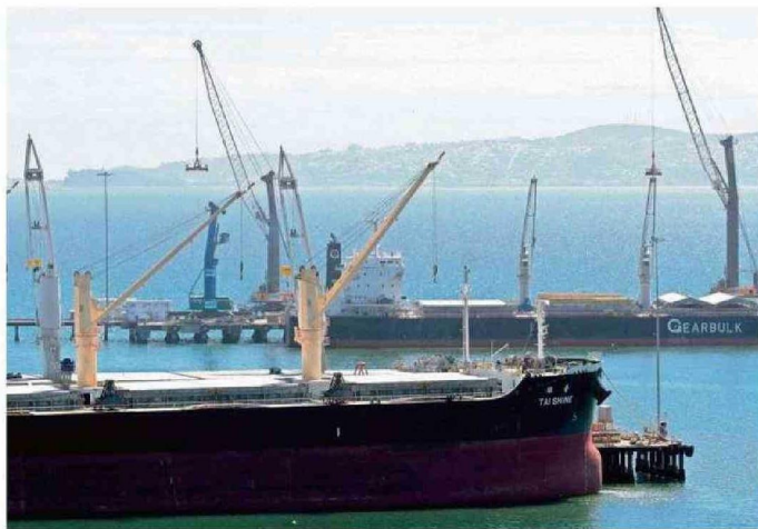
DESDE LOS PUERTOS DEL BIOBÍO SE EMBARCAN MUCHOS PRODUCTOS DE LA REGIÓN DE ÑUBLE.

Sostuvo que “nuestra Región del Biobío, en particular, se caracteriza por las actividades económicas del ámbito forestal, pesca, servicios, energía y también por ser una región portuaria. Por lo anterior, es que la constante mantención y modernización de los puntos de entrada y salida de nuestras ciudades -aeropuertos, carreteras y puertos- se vuelve fundamental por