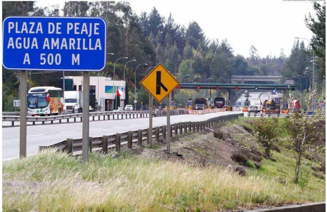
LA RUTA DEL ITATA ES LA PRINCIPAL VÍA DE COMUNICACIÓN ENTRE LAS REGIONES DE ÑUBLE Y BIOBÍO. SU BUEN ESTADO ES CLAVE PARA EL TRASLADO DE PRODUCTOS.

Recientemente se anunció la licitación de estudios para el tren Concepción-Chillán-Santiago y se tomó a aquello como un buen ejemplo de la relevancia de conectar dos ciudades clave para el país.