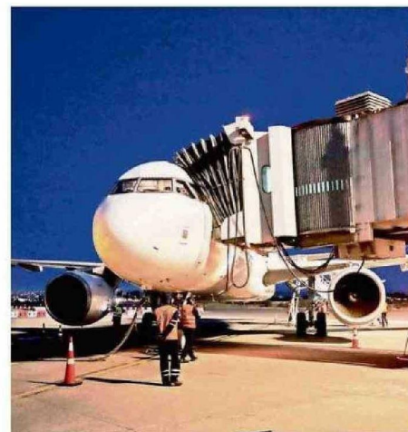
EL DESARROLLO DE CARRIEL SUR TAMBIÉN ES FUNDAMENTAL.

En ese sentido, dijo que “el poder contar con puertos cercanos, aeropuertos y carreteras de calidad, es clave no solo para dar mayor bienestar a las y los habitantes de las regiones,