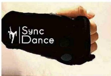
"SYNC DANCE", PROYECTO DEL MAULE, AYUDA A BAILAR A PERSONAS CIEGAS.

cuado, metano y propano. En caso de existir una fuga, envía una alerta por vía SMS a los usuarios informando y evitando una posible catástrofe", revela la joven, que se declara apasionada de la computación.