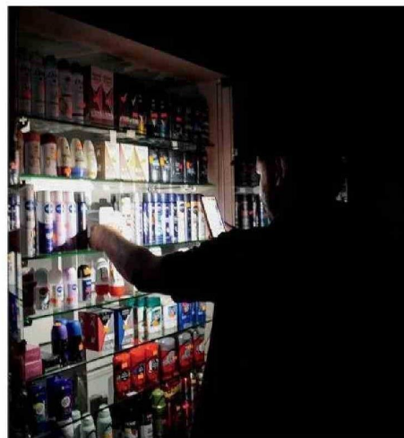
La emergencia no quedó resuelta anoche.

Tohá, en tanto, añadió que estarán en el Cogrid "hasta que se reponga totalmente el servicio" y que "si fuera necesario, se van a tomar otras medidas, todas las