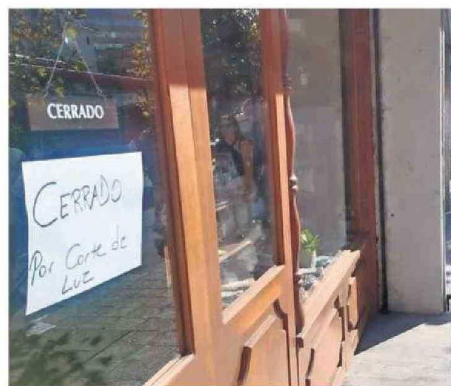
Algunos locales tuvieron que cerrar por el corte eléctrico.