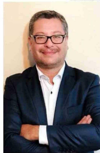
EL ALCALDE DE TEMUCO, ROBERTO NEIRA.

Al respecto, dejó en claro que se trata de una medida “disuasiva” que no garantiza la no ocurrencia de hechos de violencia y que tampoco estigmatiza a nadie, pero sí que entrega seguridad a los docentes y padres de los menores, en un contexto de aumento de la violencia escolar, refiriéndose a los últimos graves aconteci-