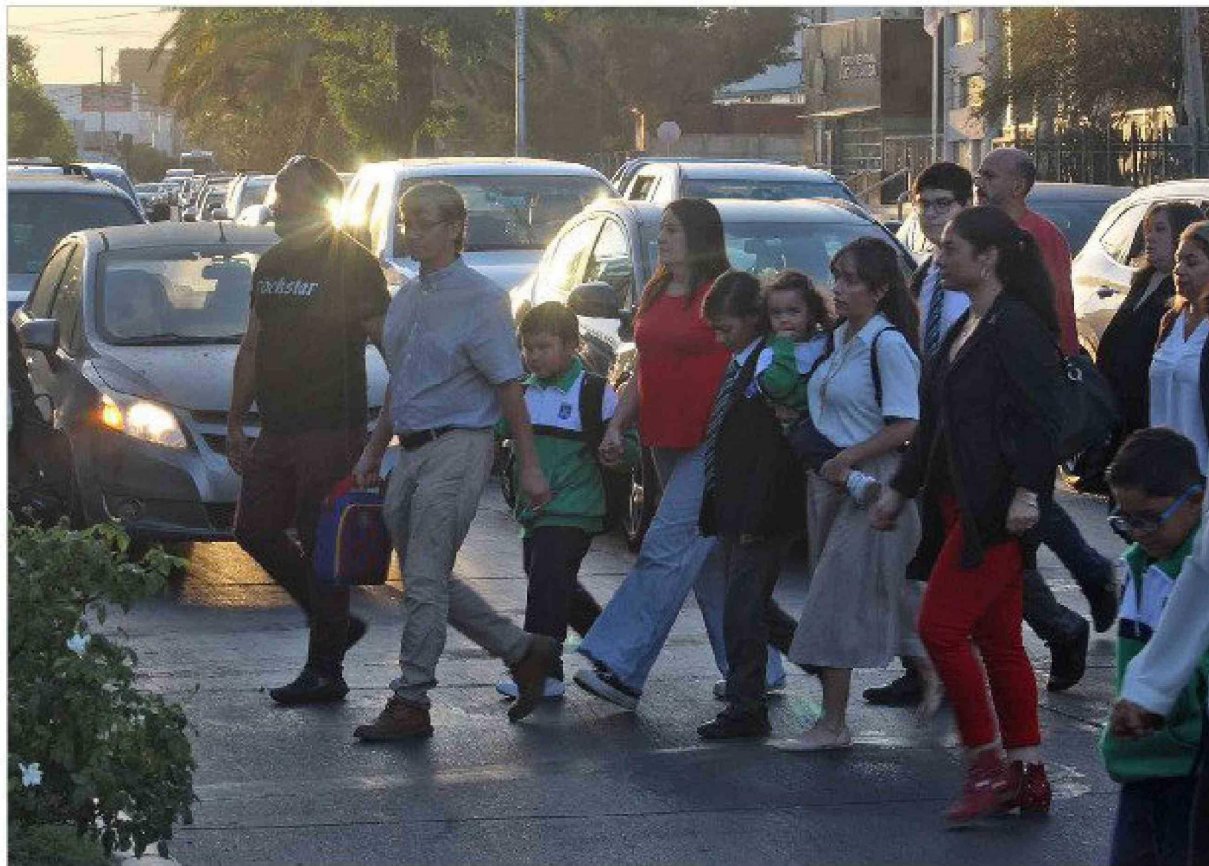
Según calendario del MINEDUC, el año escolar comienza el lunes 3 de marzo, mientras que el miércoles 5 es la entrada oficial de los estudiantes a las aulas.