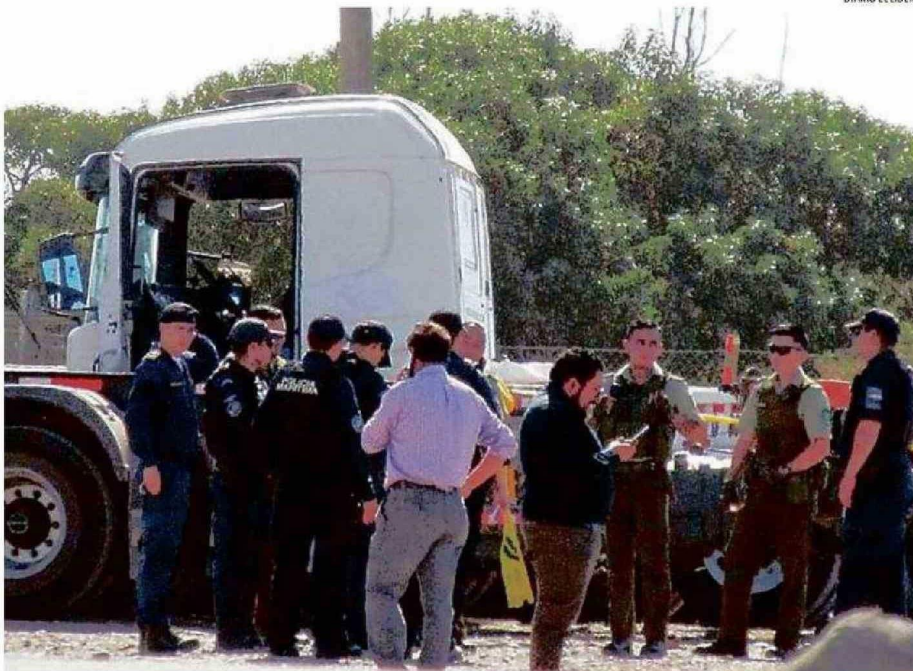
TRAS EL INCIDENTE DEL DOMINGO DURANTE LA JORNADA DEL LUNES EL LABOCAR Y EL OS-9 TRABAJARON EN EL SITIO DEL SUCESO.

-Hace como un año nos ayudó con un camión que quedó en pana y ahí lo vimos diferente porque había tenido dos infartos, estuvo hospitalizado, vendió sus camiones, nos contaba, porque perdimos un poco el contacto cuando se fue de acá. Lo vimos mal, ya no era la persona que nosotros habíamos conocido, porque andaba como muy exaltado, como que se le desarrolló una esquizofrenia, porque estaba así