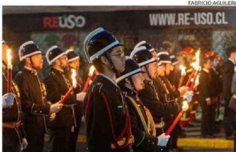
EN LA OCASIÓN PARTICIPARON VOLUNTARIOS DEL CUERPO DE BOMBEROS.