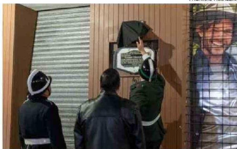
EN EL LUGAR DESCUBRIERON UNA PLACA POR EL ANIVERSARIO N°100.