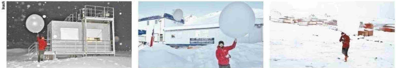
Las tres fotografías superiores muestran a investigadores con radiosondas en el Tarp de invierno (a la izquierda) y fuera de la base Escudero.