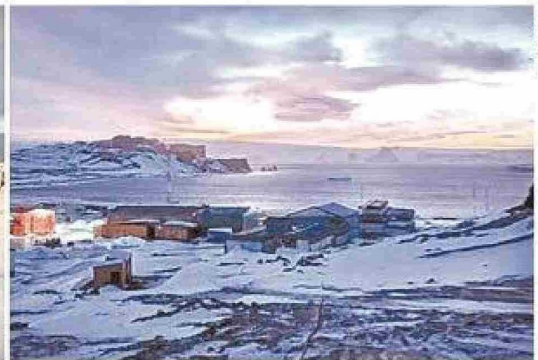
Las dos imágenes muestran cómo ha cambiado el panorama en isla Rey Jorge.