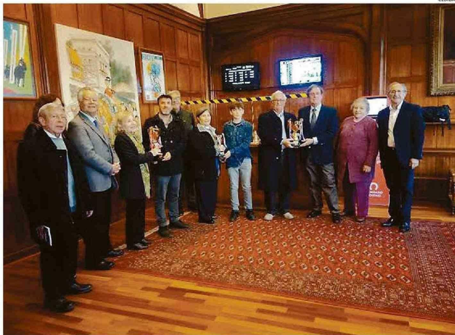
ACTIVIDADES COMENZARON EL DÍA 19 Y SE EXTENDERÁN HASTA EL SÁBADO 24 DE AGOSTO. ESTE LUNES VISITARON EL SPORTING CLUB.

escuelas normalistas llegaron a existir en nuestro país. En el año 1974 se ordenaron sus cierres definitivos.