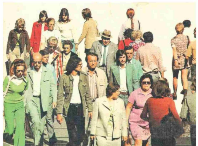
Cotidianamente somos bombardeados por una sociedad consumista -de la que somos parte- que privilegia un materialismo alienante.

Dicen que estamos viviendo más; que a los 60, 70 u 80 años aún se es “joven”; que hoy en día, los promedios de sobrevivencia son mucho mayores que los de hace 50 años atrás; que intervenciones quirúrgicas, vacunas, grageas, ejercicios y un arsenal de posibilidades terapéuticas respalda un “buen vivir”. Y lo podemos comprobar en lo cotidiano: en estrellas del espectáculo, cantantes, conductores de TV o algunos de nuestros vecinos y vecinas. Basta señalar que la medicina actual ofrece posibilidades impensadas hace unas décadas atrás. Porque hoy, la genética permite elegir el sexo de una criatura, el color de ojos y de su pelo, su estatura, habilidades intelectuales o cognitivas, pigmentación de su piel y muchos otros rasgos que antes se asignaban al azar o a la sabia naturaleza. Ciertamente, es indudable que gozamos de una mejor calidad de vida exterior, que somos más longevos que nuestros abuelos, que se puede aparentar ser un efebo a los 80 años... pero, ¿cómo está nuestra vida interior? ¿También somos más solidarios, empáticos, tolerantes, comprensivos, responsables, más humanos...? ¿Qué rol le asignamos, en ese contexto, a la sabiduría, al