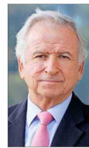
Felipe Larraín, director Clapes UC y exministro de Hacienda.

composición de estos nuevos puestos de trabajo generados", indica el reporte.