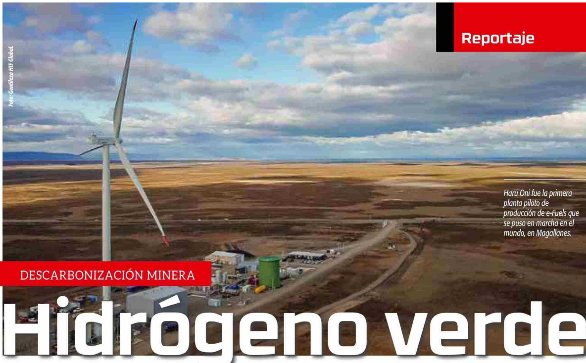
Haru Oni fue la primera planta piloto de producción de e-Fuels que se puso en marcha en el mundo, en Magallanes.