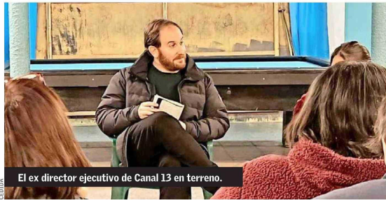
El ex director ejecutivo de Canal 13 en terreno.

La presidenta de la Comisión para el Mercado Financiero analiza los cambios y desafíos de la nueva institucionalidad, que cumple cinco años. B 9