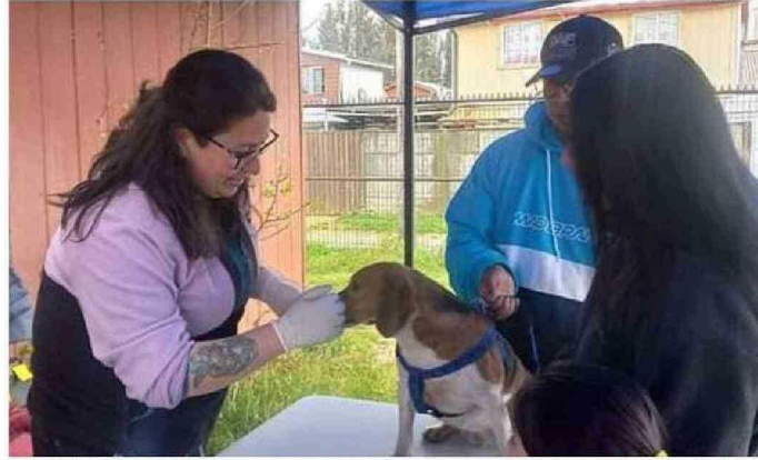
LA ESTERILIZACIÓN ES UNA FORMA DE CONTROLAR EL PROBLEMA. LA TENENCIA RESPONSABLE ES FUNDAMENTAL.

que no sólo lo hacen a los animales de granja, causan las jaurías en el campo, sino también exterminan la valiosa fauna silvestre local.