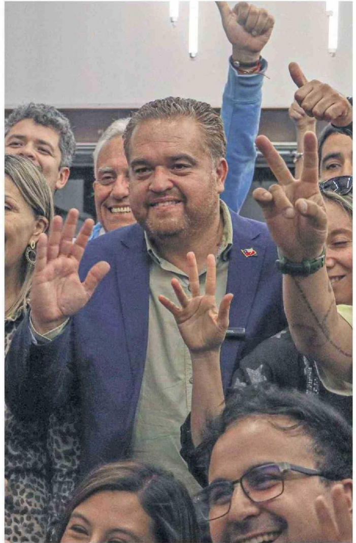
Sergio Giacaman en la primera vuelta electoral, cuando obtuvo el 24,57% de los sufragios, cifra que creció al 72,65% en la jornada de ayer.

En el tercer eje, propone defender los "motores productivos de la Región", crear una Oficina Regional de Inversiones y el desarro-