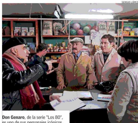
Don Genaro, de la serie "Los 80", es uno de sus personajes icónicos.

tuvo con su entonces jefe en Inchalam, y sigue: "Porque me gusta el teatro". "¡Son pampinas! Usted es buen operario. Quédese aquí. Se va a Bélgica a especializarse. Así que olvídese. No sea loco. Se le abre horizonte bueno. Lo otro es voladuras". Bueno, al final aceptó".