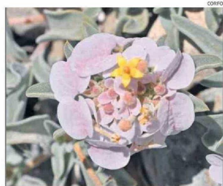
EL FENÓMENO DEL DESIERTO FLORIDO DESPIERTA GRAN INTERÉS TURÍSTICO.

Desde el Instituto Forestal de Chile (Infor) destacaron la realización de este documento