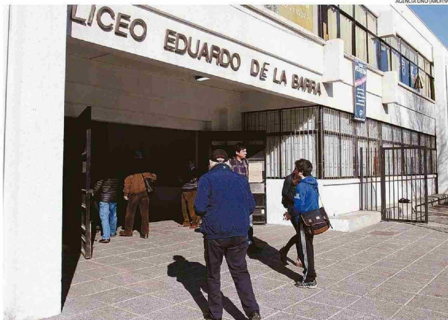
PRINCIPAL DESAFÍO DEL LICEO PORTEÑO, SEGÚN SU DIRECTORA, ES HACER PARTE A LAS FAMILIAS DE LAS TRAYECTORIAS EDUCATIVAS.

“Nuestros y nuestras estudiantes subieron mucho sus puntajes, así que estamos muy contentos, porque creemos que se empieza a consolidar un proceso postpandémico que nos costó mucho, con hartos rezagos a raíz de situaciones de salud mental, por lo tanto, no ha sido fácil retomar, sin embargo, hoy día estamos contentos con los resultados”, declaró la di-