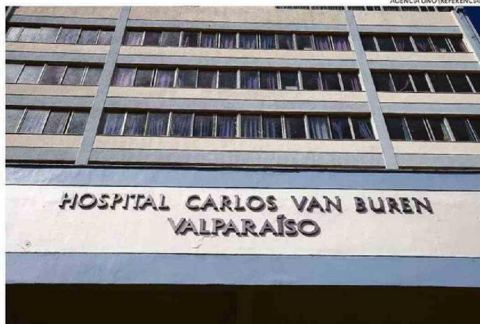
HOSPITAL ASEGURÓ QUE MÉDICOS TOMARON LICENCIAS Y PERMISOS DURANTE ESTAS FECHAS.

Esto, en particular, por "la falta de adquisición y renovación de equipamiento crítico, la carencia de insumos esenciales para la realización de procedimientos básicos de la especialidad y la casi nula disponibilidad de quirófanos, que se