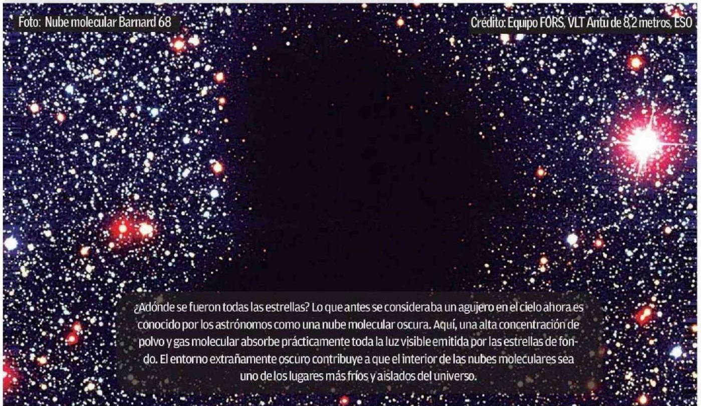
Foto: Nube molecular Barnard 68