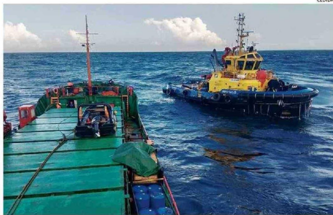
LA MOTONAVE ANTONIO SERÁ REMOLCADA AL CONTINENTE.