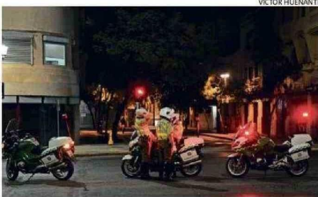
AYER SE LEVANTÓ EL TOQUE DE QUEDA PARA LAS 14 REGIONES.

central termoeléctrica Ventanas fueron algunos de los activos de generación que no funcionaron o tuvieron fallas.