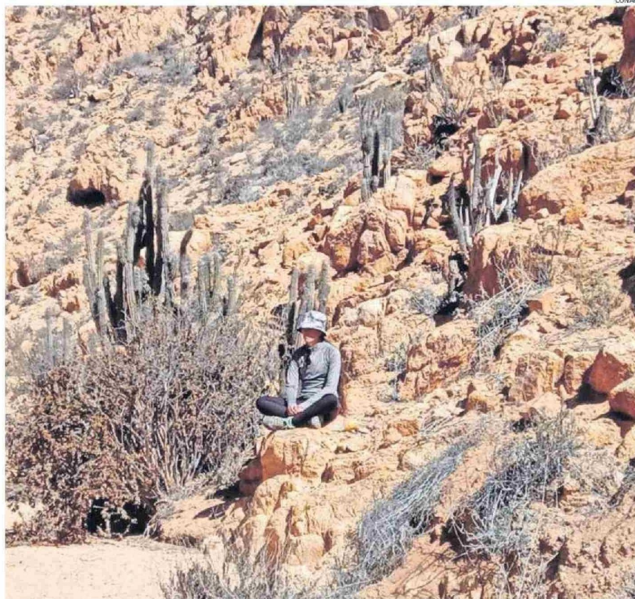
LA ZONA TIENE MAYOR VEGETACIÓN Y CONCENTRACIÓN DE BIODIVERSIDAD, ADEMÁS DE SER UN SITIO LIBRE DE CONTAMINACIÓN ACÚSTICA.