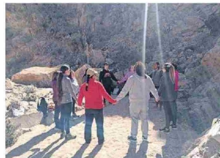
HUBO UNA MUY BUENA ACOGIDA Y EVALUACIÓN.