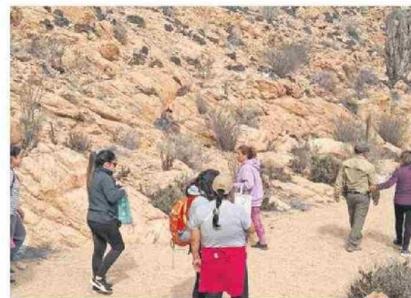
ES UN SERVICIO COMPLEMENTARIO A LA SALUD TRADICIONAL.