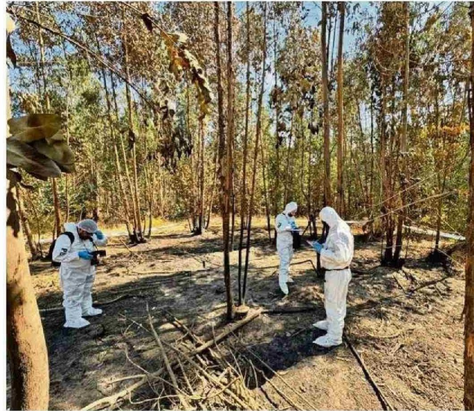
GREMIOS FORESTALES PLANTEAN QUE SE DEBE MEJORAR LA PREPARACIÓN DE EQUIPOS INVESTIGATIVOS.

"En febrero tuvimos dos semanas en donde tuvimos numerosos incendios con multifocos. Si bien la recurrencia ha disminuido, los números en general dicen que, en lo que va de la temporada, se ha podido confirmar que un 26% de los incendios fue-